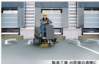
製造工場 出荷場の清掃に