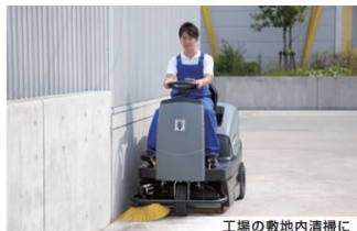
工場の敷地内清掃に